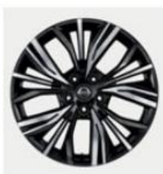
JANTĂ 19" AKARI DIN ALIAJ