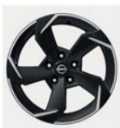
JANTĂ 17" DIAMOND CUT DIN ALIAJ