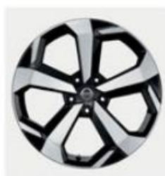
JANTĂ 19" DIN ALIAJ DIAMOND CUT