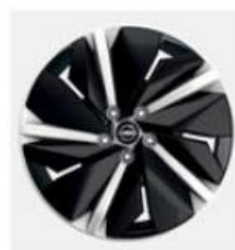
JANTĂ 19" AERO DIN ALIAJ, ÎN DOUĂ CULORI (2)